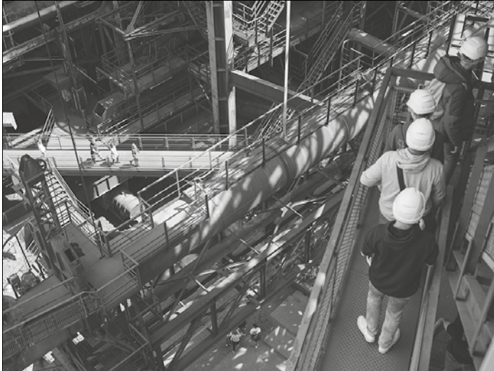
Aufstieg zur Gichtbühne

erhaltene Eisenwerk aus der Blütezeit der Industrialisierung und zugleich das erste Denkmal dieser Epoche, das in die Welterbeliste der UNESCO aufgenommen wurde. Heute bildet die Völklinger Hütte mit ihren zahlreichen Hallen, Freiflächen und dem fesselnden Gewirr der Rohrsysteme einen einzigartigen Schauplatz internationaler Ausstellungen, Festivals und Konzerte. Zur Kultur gesellt sich die Natur: Das Paradies, hervorgegangen aus der einstigen „Hölle“ der Kokerei, fasziniert durch die Rückeroberung von Teilen des Geländes durch vielfältige Flora und Fauna. Zu diesen verschiedenen Facetten bietet das Weltkulturerbe am Sonntag, den 10. September, zum Tag des offenen Denkmals 2023, öffentliche Führungen an.