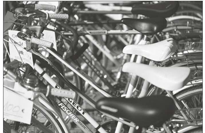
Eine große Auswahl gebrauchter Räder findet sich auf der Saarbrücker Fahrradbörse