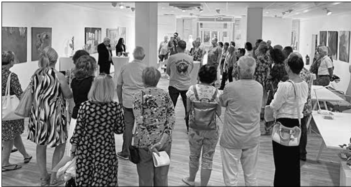
Unter anderem über Events und Workshops informiert der Newsletter des Völklinger Citymanagements. Das Foto entstand bei der Eröffnung der Kunstausstellung „Sichtweisen 2023“ im City-Büro.

Mit dem Newsletter strebt das Citymanagement Völklingen an, Bürgerinnen und Bürger näher einzubinden und das vielfältige Stadtgeschehen transparent zu präsentieren.