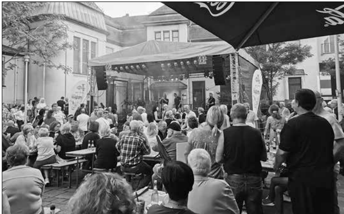
Voller Pfarrgarten beim Auftritt von „The Alligators“ am 17. August 2023

Ein großes ‚Danke‘ gilt natürlich allen Besucherinnen und Besuchern, die den Weg immer wieder in den Pfarrgarten gefunden haben und auch teilweise dem Regen trotzten.